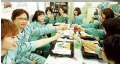
社内の親睦花見会、夏はビアガーデン、 秋は芋煮会、冬は忘年会と続きます